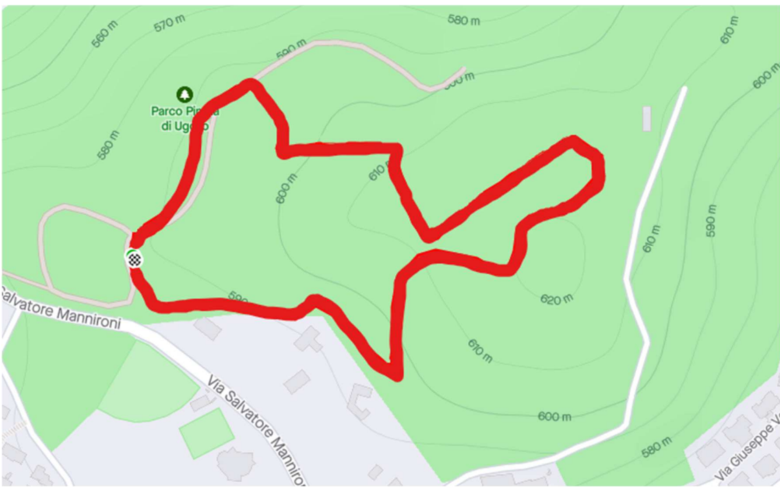
Figura 2 - Tracciato del campo di gara